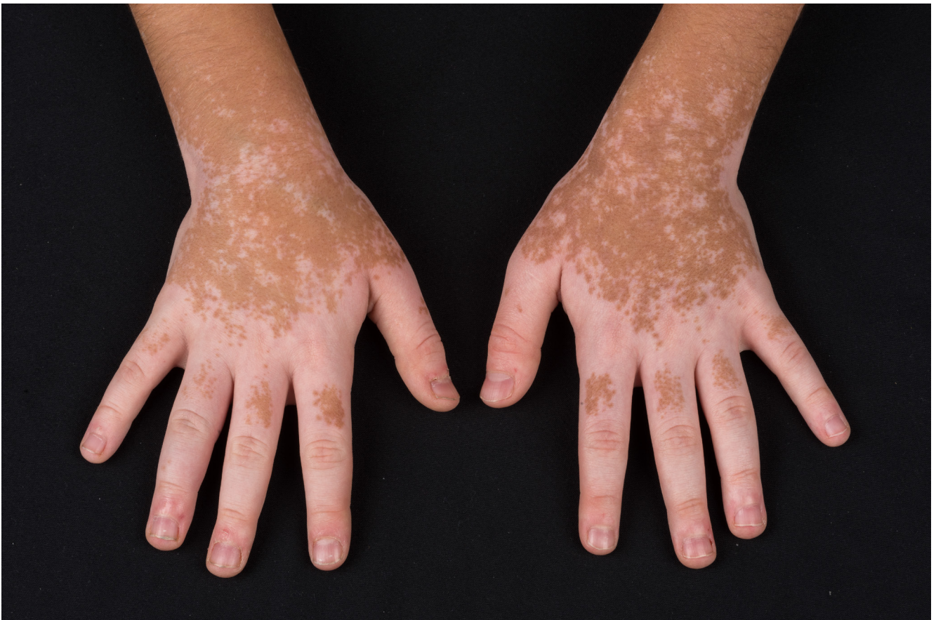
Abbildung 2. Progressive nicht-segmentale Vitiligo der Hände

Narrowband UVB (311 nm) phototherapy (narrowband UVB, NB-UVB) is indicated for vitiligo if topical therapy no longer appears practicable due to the extent of the disease. Early whole-body phototherapy is particularly indicated for active vitiligo to cease the disease activity. In addition, the response to therapy is inversely related to the duration of the disease (better response seen when the disease is of short duration). As with topical medication, depigmented areas in acral localizations, nipples, and the genital area, as well as vitiligo areas with leukotrichia, respond poorly or not at all to phototherapy.