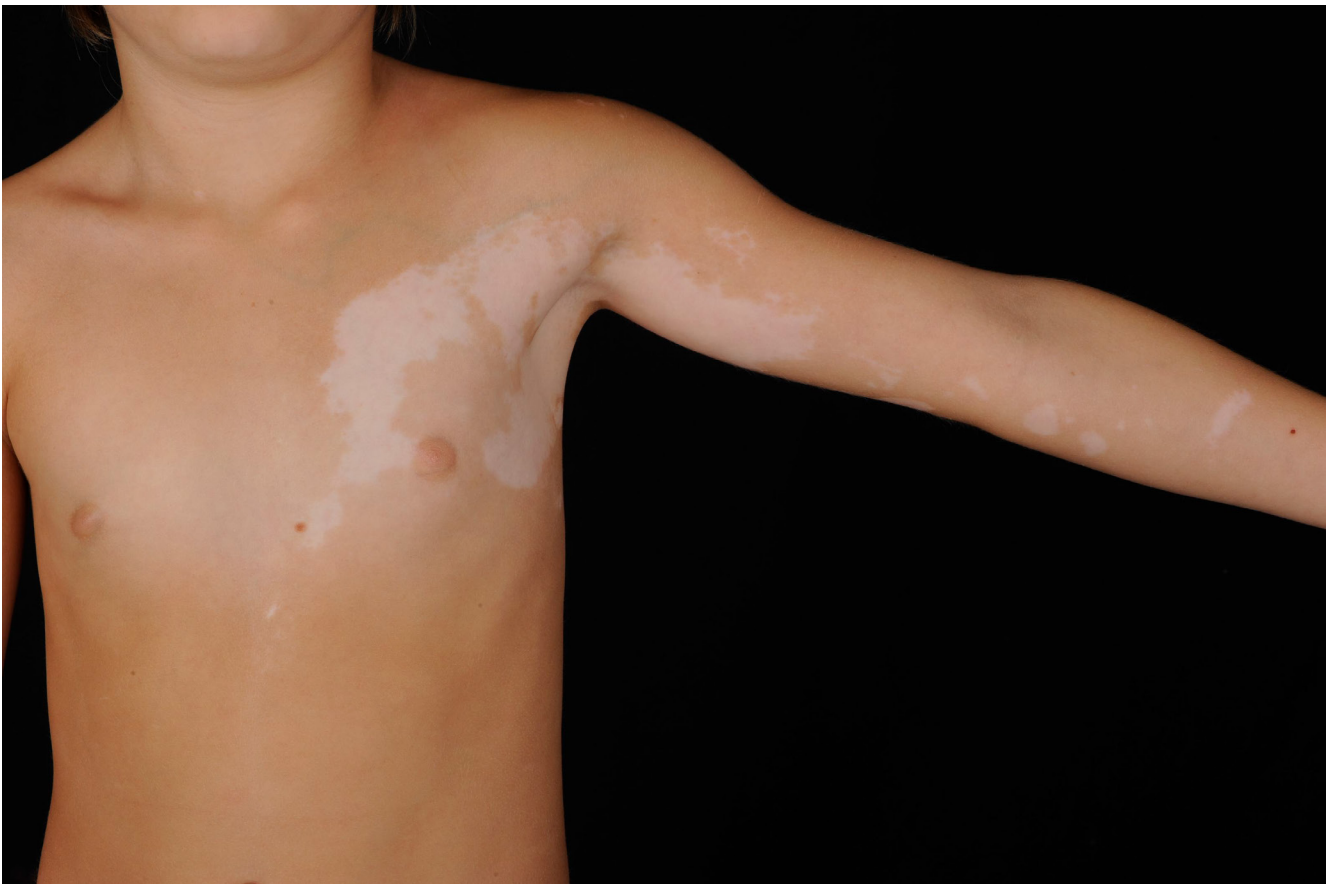
Abbildung 1. Segmentale Vitiligo an der Brust und am Arm linksseitig.

The initial vitiligo findings should be documented before starting treatment using photos, sketches, and/or a score (BSA, VASI, www.vitiligo-calculator.com ). Laboratory tests for the initial diagnosis of vitiligo include thyroid parameters (TSH, as well as anti-TPO, anti-TG and TR-AK). If there are anamnestic indications of the presence of other autoimmune diseases, a correspondingly extended laboratory examination is recommended (blood sugar, vitamin B-12). Functional eye involvement is not to be expected due to vitiligo, but dry eye syndrome is more common 14 .